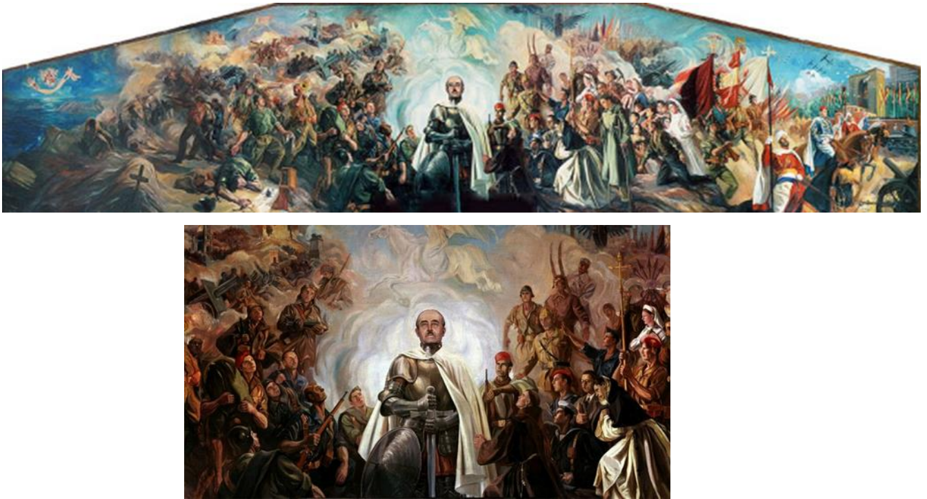
Figura 10) Mural "Alegoría de Franco y la Cruzada" de 1948 Arturo Reque Meruvia; detalle mural Franco.

A la obra Arturo Reque Meruvia de lleno la cita de Palacios (2011):