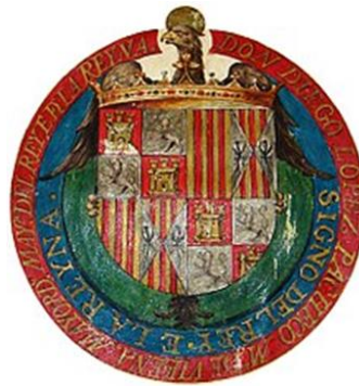
Figura 2) izquierda 1939 General Franco y escudo de España derecha) 1491escudo reyes católicos Acta Concesión de privilegios el Solar de Tejada firmada por los Reyes Católicos