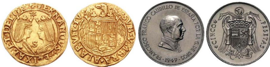
Figura 5) Izquierda moneda Excelente de Granada de 1497/1504 derecha moneda 5

En cambio en la moneda encontramos las alas del águila más de perfil marcando un ritmo de C que enmarca la parte superior del escudo. Existiendo tres largas plumas por lado del escudo que crean un ritmo visual que termina por crear una S. Dando así mayor dinamismo y expansión visual al escudo en su imagen general. Por otra parte, el escudo es coronado por un mayor atributo regio. La corona es mucho más grande, detallada por lo que le da un peso visual mayor. También cabe hacer foco en el cuello del águila el cual tiene las plumas como en una posible posición de grito. Pose posible, como alusión al comienzo del evangelio de San Juan “en el principio exista el verbo y el verbo estaba junto a Dios y el verbo Dios”.