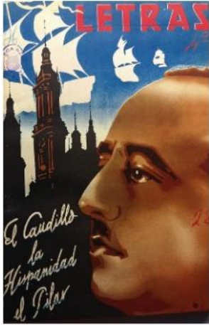
Figura 14) tapa revista Letras número 4, 1940

fe que aportó al nuevo mundo. Es decir, otro ejemplo del uso de las conquistas trasatlánticas de los reyes católicos para reforzar el papel de la nueva España católica con un poder centralizado en sus relaciones con Hispanoamérica.