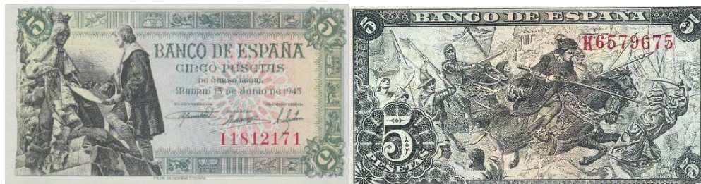
Figura 7) Billete 5 pesetas 1945; frente reina Isabel y Colon dorso escena de guerra de reconquista

En su dorso el billete trae una escena de guerra contra el moro. Otro tema muy caro al franquismo que trato desde el comienzo del levantamiento de exponer sus acciones bélicas como parte de una cruzada o una guerra de reconquista, esta vez ya no contra el musulmán sino contra el ateo comunista. Por lo que en un solo dispositivo tenemos dos grandes aportes de la reina que son transpolados a la actualidad por el medio peseta y por el discurso franquista.