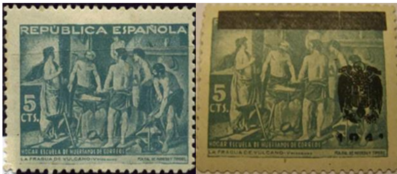
Figura 3) de izquierda a derecha estampilla república española 5 centavos serie Velázquez; 1941 estampilla república española 5 centavos serie Velázquez resellado escudo franquista

Este tipo de resellados es interesante porque se trató de mantener, en lo posible, la obra editada en tiempos republicanos sin mayores modificaciones. En este caso la estampilla edita la obra la fragua de Vulcano de Diego Velázquez, con un valor de 5 centavos. Con el resellado se mantuvo el valor de estampilla (5 cts) no se invadió la imagen solo se tapó el título del emisor, república española y como símbolo del cambio de gobierno solo se estampó el escudo nacional en un ángulo inferior.