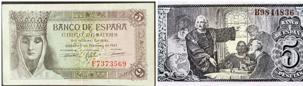
Figura 6) Billeto 5 pesetas 1943. Frente Imagen Isabel la Católica dorso imagen Colón exponiendo el proyecto de su expedición.

Es posible que por esas razones encontremos el retrato de la reina que consigue unir España en el frente de los billetes de 5 pesetas de 1943 y en su reverso uno de sus mayores éxitos, la campaña de descubrimiento de América por el Genovés Cristóbal Colón. La reina es representada con un rostro joven, bello y con gesto adusto, mirada baja cabeza cubierta con una piadosa toca y portando como atributo real una gran corona.