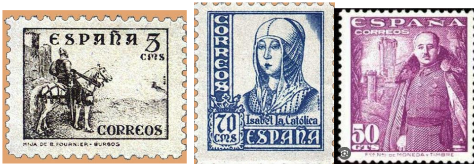
Figura 1) 1937 a la derecha El cid; a la izquierda Isabel la católica, Franco

Es decir, en la estampilla encontramos a Franco, el Castillo su pasado ligado a Isabel I y además un presente ligado a la Falange. Pasado y presente se unen en esa construcción como si quiera que se trasmite la gloria de la reina al presente de la sección femenina de la falange que estaba presidida ni mas no menos que por Pilar Primo de Rivera, hermana de José Antonio Primo de Rivera, fundador de la Falange Española e hija del dictador Miguel Primo de Rivera.