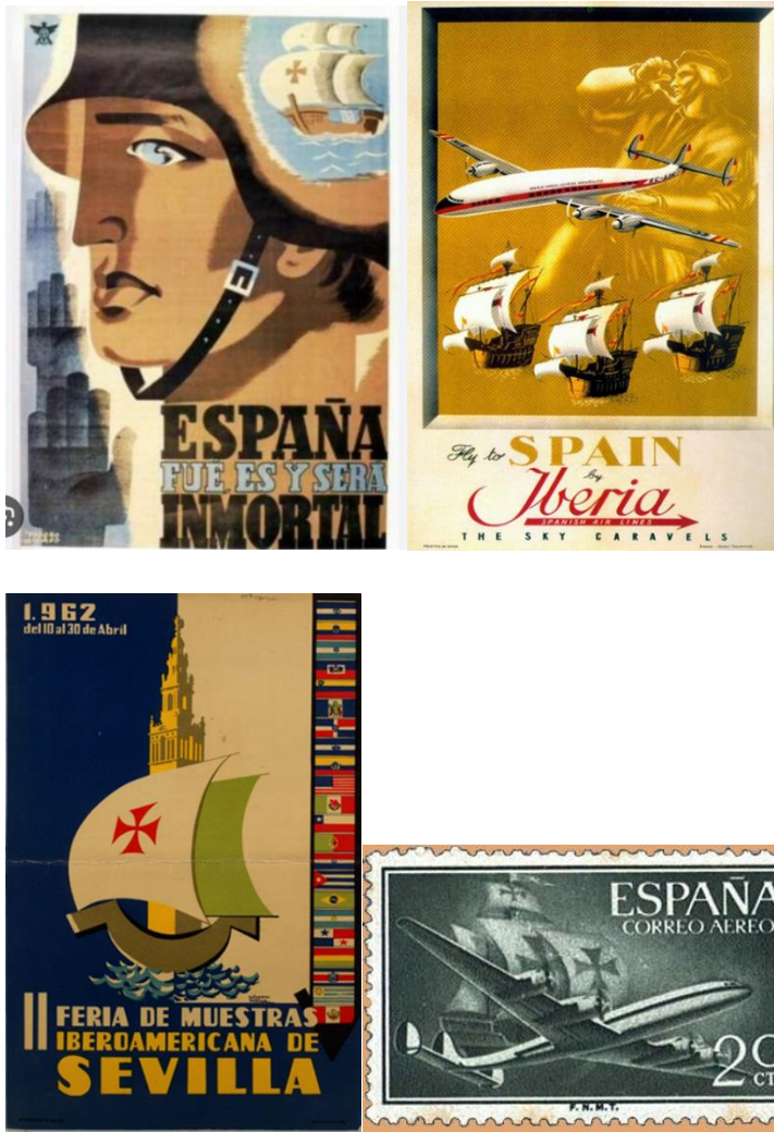
Figura 13) España fue es y será inmortal Servicio de propaganda, departamento plásticas 1936-1939, Fly to Spain propaganda línea aérea Iberia 1950; poster II feria de muestras iberoamericana de Sevilla de 1962; estampilla 20 cts. serie Superconstellation y nao Santa María.

Otro claro ejemplo de uso simbólico de las naves de Colón en el contexto del primer franquismo lo vemos en la tapa de la revista Letras de 1940. En esa imagen encontramos un perfil del dictador que ocupa gran parte de la tapa y tras él, la silueta de la Basílica del Pilar de Zaragoza y por sobre ellas las siluetas en blanco de las tres carabelas.